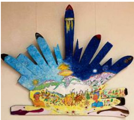
«Wabi Sabi» von Juan Rios.

Eröffnet wird das Kunsthaus am Samstag, 28. Mai, um 15 Uhr, im Rahmen des Festaktes. www.kunsthauklosters.ch