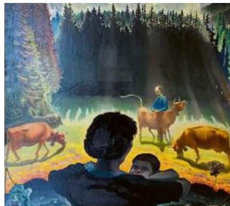
Wieder zu sehen: Bilder von Ernst Schäublin.